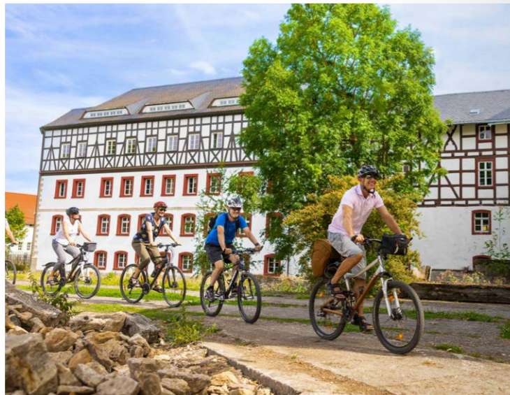
Kunst- und Senfmühle in Kleinhetstedt | 2. Etappe

Das ehemalige Weinberghaus im Park an der Ilm war Johann Wolfgang Goethes erster eigener Wohnsitz in Weimar. Bis zu Goethes Umzug an den Frauenplan 1782 war es sein hauptsächlichlicher Wohn- und Arbeitsort. Nach seinem Tod war es eine Wallfahrtsstätte der Goetheverehrer – bis Goethes Wohnhaus in der Stadt als Museum eingerichtet wurde.