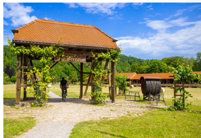
Thüringer Weintor am Gradierwerk Louise in Bad Sulza | 5. Etappe

Die Ölmühle Eberstedt ist ein besonderer Ort für eine kleine Auszeit. In der Mühle aus dem Jahr 1906 genießt Du historisches Ambiente mit rustikalen Holzbalkendecken, alten Mahlwerken und Mühlensteinen, eine original erhaltene Ölpressen und ein Zuppinger Wasserrad, welches heute noch zur Stromerzeugung genutzt wird. In schwimmenden Hütten kannst Du übernachten und Dich von der Etappe erholen. Außerdem gibt es ein Landhotel mit Restaurant, Biergarten, Spielplatz, aber auch ein Streichelgehege und einen Forellenteich, mit der Möglichkeit zum Angeln.