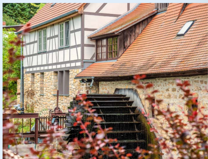
Buchfarter Mühle | 3. Etappe

Du liebst Kulinarik und Genuss, dann ist der Ilmtal-Radweg genau das Richtige für Dich. Entdecke in den Hofläden und Manufakturen entlang des Weges die leckeren Thüringer Spezialitäten und regionalen Produkte. In der Senfmühle in Kleinhetstedt kannst Du über 20 Sorten Senf probieren. Perfekt dazu passt eine Original Thüringer Rostbratwurst frisch vom Rost. Oder wie wäre es mit einem Stück des typischen Thüringer Blechkuchens? Gelegenheiten für einen Kaffee und eine appetitliche Kleinigkeit bieten sich immer wieder wie z. B. im »Ateliercafé Flow« in Kranichfeld oder im »Bistro Veloc« in Bad Berka. Naschen den leckeren Bienenstich im Bienenmuseum in Weimar oder schlemme entspannt und nach Herzenslust in der »Alten Remise« in Tiefurt. Und zum gelungenen Abschluss deiner Tour kannst Du in den Weingütern rund um Bad Sulza die besten Weine Thüringens verkosten.