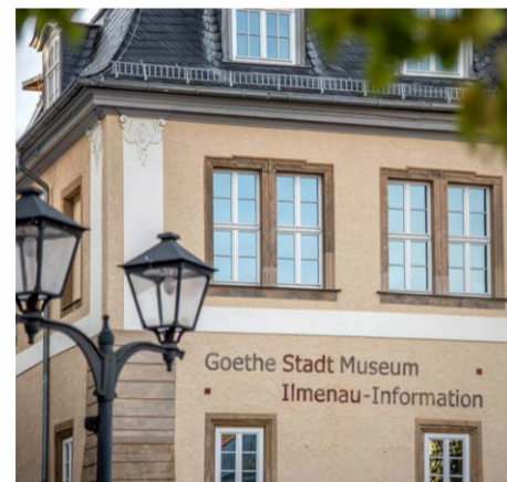
GoetheStadtMuseum Ilmenau | 1. Etappe