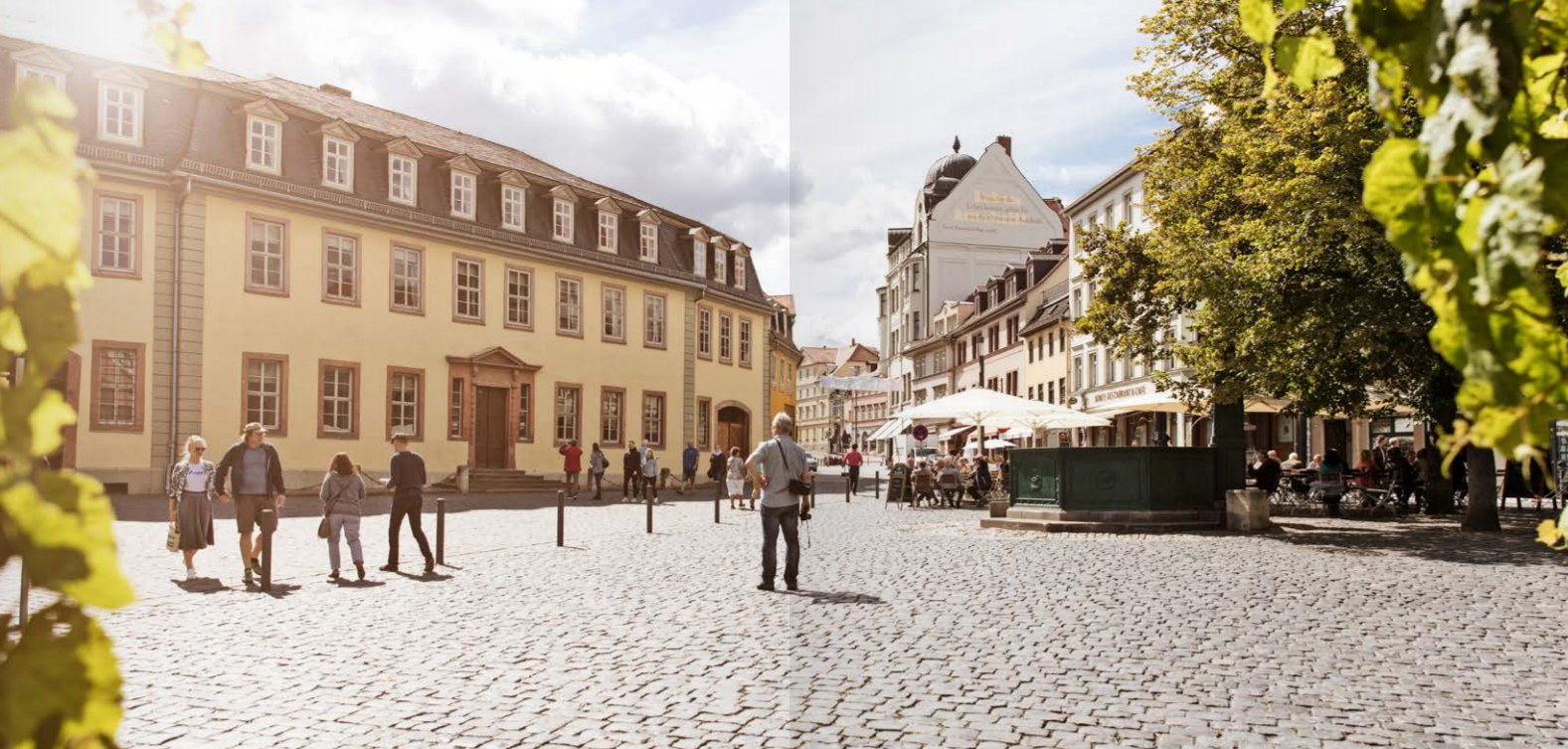
Goethes Wohnhaus, Weimar | 3. Etappe