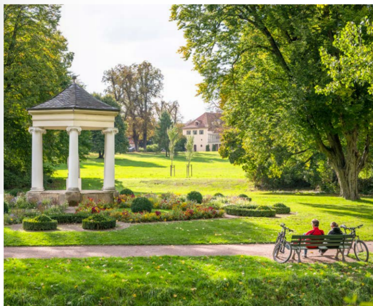
Der Musentempel im Schlosspark Tiefurt | 4. Etappe

Das bereits 1907 gegründete älteste Bienenmuseum Deutschlands bietet Interessantes für Erwachsene und Kinder. Hofladen, Café mit Biergarten, Märkte und Veranstaltungen runden das Angebot ab. In einer Dauerausstellung wird auf die Biene und die Kulturgeschichte der Imkerei eingegangen. Empfehlenswert ist ein Spaziergang über den Museumshof bis in den Bienenweidegarten. Und im Hofladen findest Du garantiert ein süßes Souvenir.