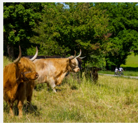
links: Ilmtal-Radweg bei Oettern | 3. Etappe unten: Die schwimmenden Hütten der Ölmühle Eberstedt | 4. Etappe